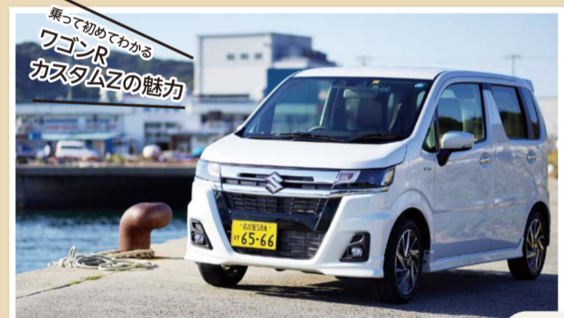
新型ワゴンカスタムZと背景は豊浜 魚ひろば