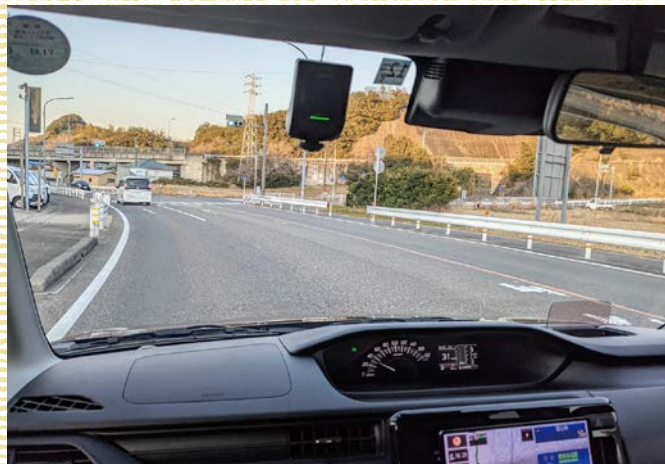
視界が広いから、運転しやすい