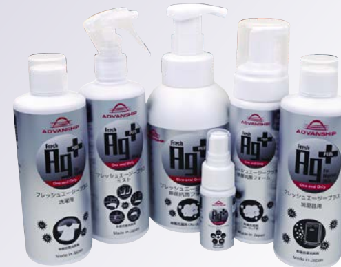
いろいろなシーンに合わせて取り揃えております。