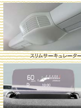
スリムサーキュレーター