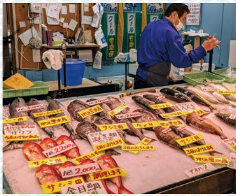
◆ 最盛期はどのような感じですか? 想像がつかないんですけど、だいたい、水槽1本が1トン水槽。多い時は450トンくらいやっただのかな。それを3社で分けるんですよ。最盛期はみんな、ウロコみれでものすこいことになりました。大きい水槽を小分けにするんですよ。それぐらいの量になるとさすがに僕らもヒール言いますけど、350トンくらいだったらなんなくこなせます。そのうち、うちが買うのがだいたい6割多い時でだいたい200トンくらい。

◆ 営業マンから魚屋さんに転身されて、いかがでしたか? 初めは魚のウロコを取ることも、3枚におろすこともできなかったです。忙しい時は、肉休労働で動けばいいんですけど、魚を開くことは正直慣れなかったんですけど、失敗しながらやって、何とかなるもんです。今は、鯛ぐらいでしたら、ササッと開けますね。