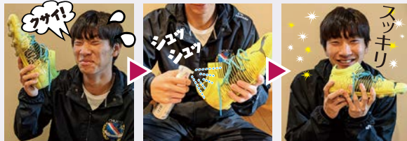
部活後のスパイクに スプレーしてみると… 臭いスッキリ!