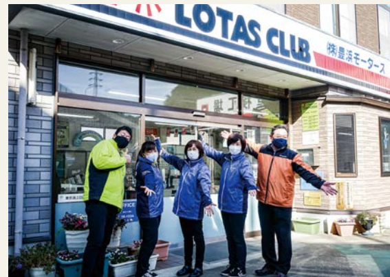
書き間違えとかがあると、翌日、名古屋まで持って行ったときに書類不備で陸運局から「ダメですよ」とか言われます。

◆ 今のお仕事は？ 受付(お客様の対応)と事務(経理や保険のこと)とか、いろいろな役割があります。車のことを聞かれることもありますよ。 ◆ モーターズで働くきっかけは？ 最初の入社時は18歳の時。高校の時の求人が入りました。33年前。その時はまだ、会長が社長の時。一度完全に退職して平成27年に2回目に再入社したんです。 ◆ お仕事の内容は？ 前回に入社した時とは今の状況が全く違うので。保険のこともでし、前は全くやってなかった名義変更とか廃車の手続きとかも今はやっています。それも覚えていくことがいっぱい。公的な書類(印鑑証明や実印)でお客様の大事なものを取り扱っていますので、「印鑑が押してなかった」とか「書いたけど