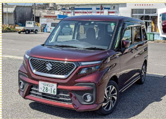
一目惚れ…しちゃいます