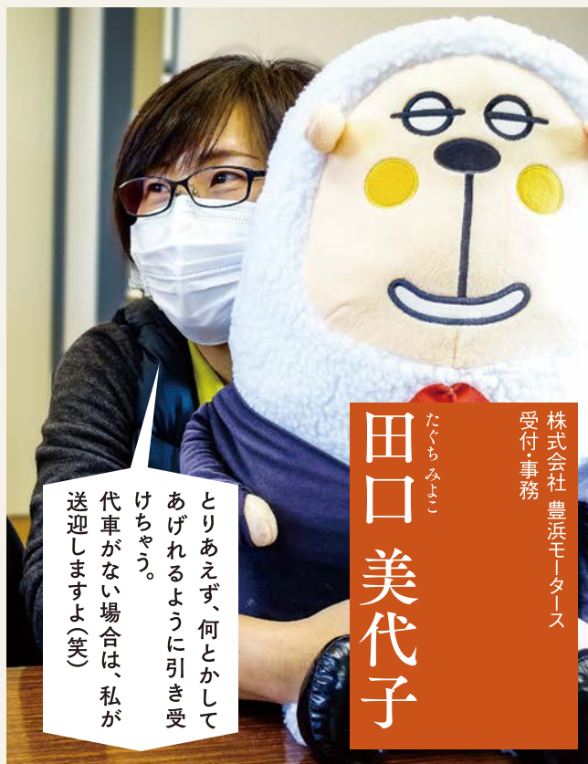
株式会社 豊浜モーターズ 受付事務