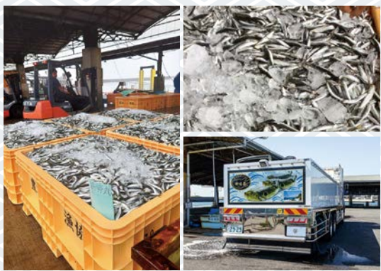
先代、先代がやっていたことを僕が受け継いでいます。

◆ お任せ川栄さんのお仕事のことを教えてください。 養殖所には鯛、はまち、カンパチ、ワラサなどの魚がいます。その魚に食べさせる餌(イワシ、カタクチいわし)を15kgぐらいに固めて、それを養殖所に送るのがウチのメインの仕事です。大きな冷蔵庫を持っていて、もうすぐシーズンが始まります。早ければ6月ぐらいかな。夏はそちらがメインです。今は、生餌とペレットという調味料みたいなものを混ぜて渡すんですけど、エサの価格が高くなってきているから、モイストペレットというのに移行しつつあるっていうのは聞きます。ただ、全部をモイストペレットにしてしまうと養殖所の魚の味がだいたい変わってしまうので、生餌を積極的に与えたいっていうのは言われるんですけど、こっちの方が高くなってきているから。岡山の方では、餌に柑橘系のミカンとかを入れたりして、ブランドを作ったりしています。お客さんは、九州や鹿児島。ここで冷凍したものを積み込んで向こうへ運びます。7、8月の多い時は、大きなトレーラーが7台とか着きます。餌は日本全国で買うんですけど、例えば今だと、千葉の銚子とか沼津とかが主流で、日本海側もまたそういうところがあって、日本中から集めてくる。