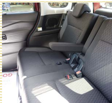
ボディはコンパクト。なのに、スペースは広々。